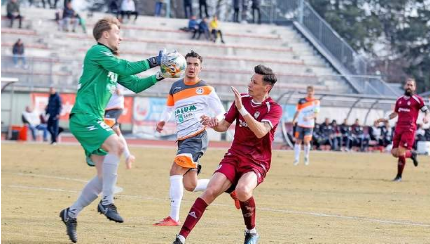
Nogometaši Triglava bodo tekme lahko igrali tudi pod reflektorji.